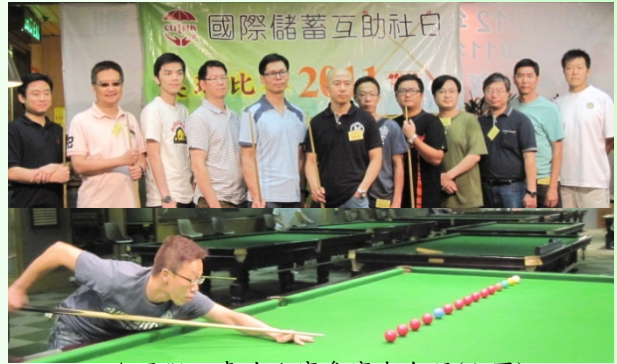
▲國際日桌球比賽參賽者合照(上圖) 參賽者挑戰賽前熱身遊戲 - 「快速清枱射球」(下圖)