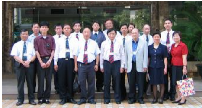
各董事與訓練中心職員合照 會長致送紀念品予廣州市統戰部副部長李小勉女士