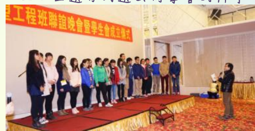
▲有意擔任同學會幹事的同學

基於第一屆畢業生就讀的大學分佈在廣東省不同地區，加上學業繁忙，同學難有機會聚首一堂，舉辦大型聚會，所以他們都把握這難得的機會，互相分享近況和