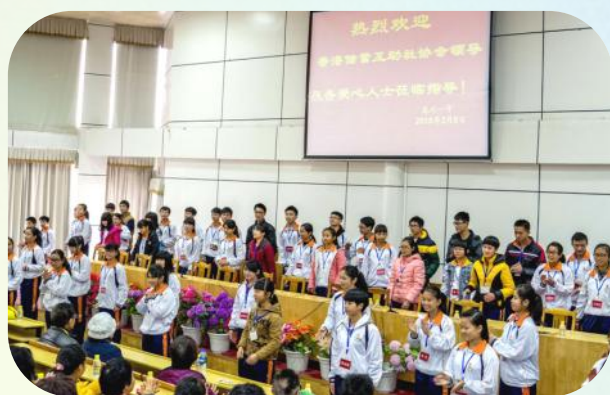
▲手語表演《感恩的心》

當日除了有第四屆希望工程班同學以簡報及短片匯報在上學期的校園生活外，更為大家準備了手語表演，配以歌曲《感恩的心》，表示自己不會輕易向命運低頭和對各贊助者無私奉獻的謝意。