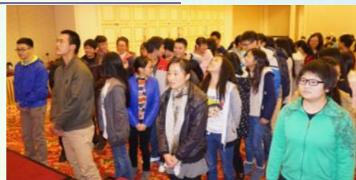
▲以互選方式選出同學會的幹事