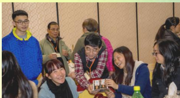
▲畢業同學藉此機會，與贊助者、老師及同學們分享近況。

基於第一屆畢業生就讀的大學分佈在廣東省不同地區，加上學業繁忙，同學難有機會聚首一堂，舉辦大型聚會，所以他們都把握這難得的機會，互相分享近況和