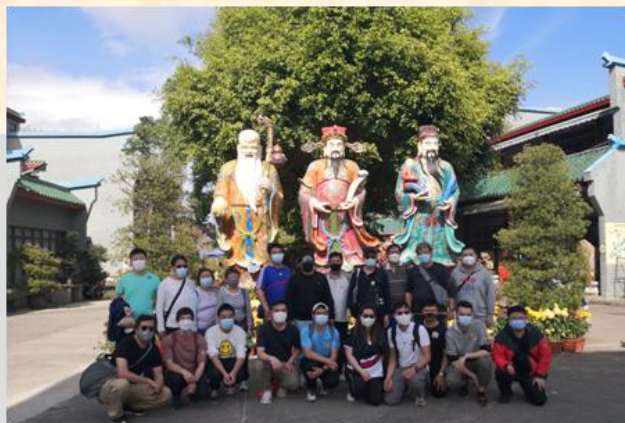
大澳水鄉·寶蓮禪寺一日遊 2023年3月26日