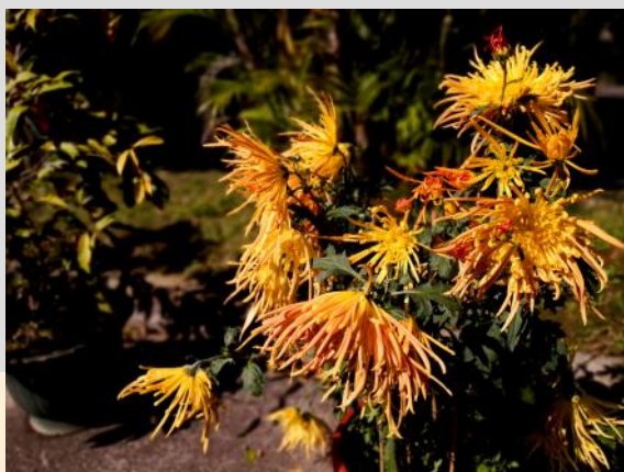
流水響·雲泉仙館一日遊 2023年2月18日

隨著新冠疫情趨緩，社會活動逐漸恢復，「易達行旅遊」繼續推出長者慈善旅遊，以特惠團費為社區長者提供本地旅遊活動，冀與眾同樂之餘，為社區增添一分關懷與照顧，貫徹儲社「自助互助」及服務社會的精神。