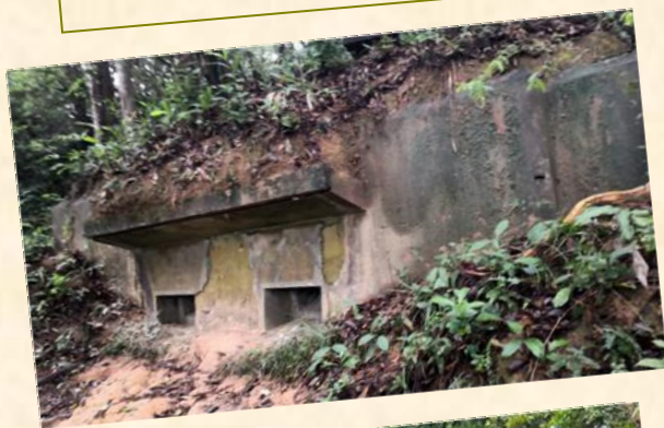
沙頭角機槍堡一日遊 2023年4月2日