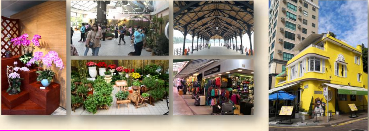
2022 年 12 月 11 日 蛇宴歡聚海濱遊