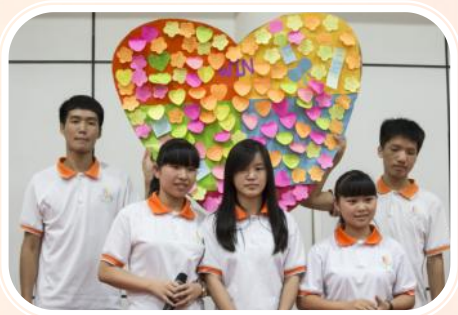
▲高二及高一同學製作了心意卡，寫上對畢業班同學的祝福。