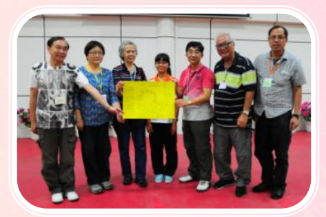
▲高一同學亦準備了心意卡送予香港的一眾熱心人士。