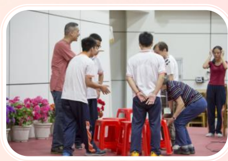
▲各熱心人士與畢業班同學一同遊戲，使整個打氣加油晚會增色不少。