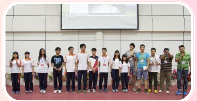
▲匯資亞洲集團(香港)送贈禮品予同學

晚會節目豐富，除表演外，更難得的是十二位第一屆希望工程班畢業同學，不辭勞苦地回到母校為他們送上祝福；